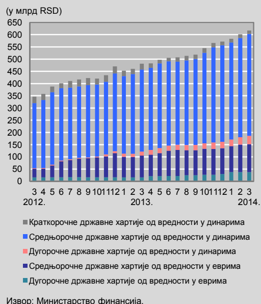
Графикон 4. Структура рочности јавног дуга по основу продатих државних ХоВ на примарном тржишту