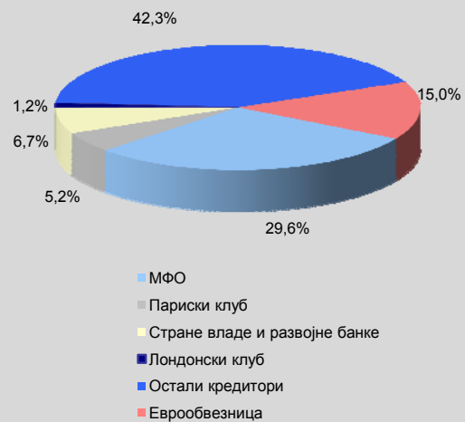
Графикон 2. Спољни дуг Републике Србије по инокредиторима (на дан 31. марта 2014)

2.3. Спољни дуг осталих сектора повећан је у посматраном периоду за 0,03 милиона евра, на 1,4 милиона евра.